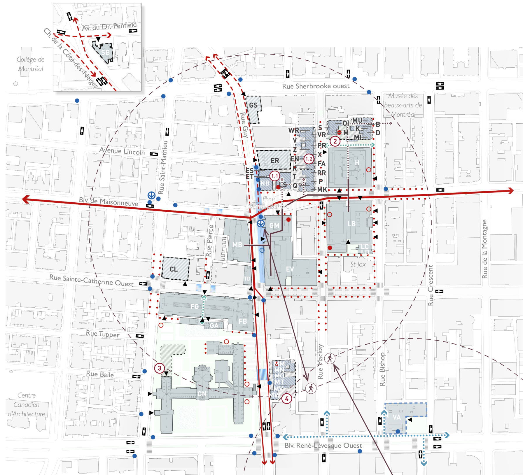
Mobilité active et transport collectif